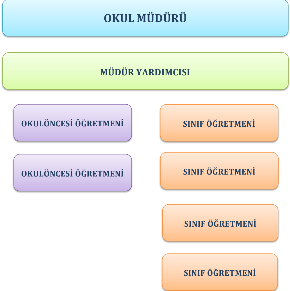
Şekil 4. Şenyurt İlkokulu Teşkilat Yapısı

Okulumuzun teşkilat yapısına baktığımızda ise kurumumuzun tüm faaliyetlerinden sorumlu okul müdürü onun da altında okulun tüm faaliyetlerini yürüten 1 müdür yardımcısı, 2 okulöncesi öğretmeni ve 4 sınıf öğretmeni olduğunu aşağıdaki şemada görmekteyiz.