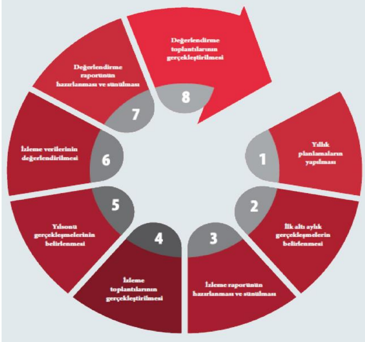
Şekil 5: İzleme ve Değerlendirme Süreci

Yılın tamamına ilişkin ikinci izleme kapsamında ise harcama birimlerinden sorumlu oldukları performans göstergeleri ve stratejiler ile ilgili yıl sonu gerçekleşme durumlarına ait veriler toplanarak raporlanacaktır. Stratejik Plan Değerlendirme Raporu, üst yönetici başkanlığında yapılan değerlendirme toplantısında stratejik planın kalan süresi için hedeflere nasıl ulaşılacağına ilişkin alınacak gerekli önlemleri de içerecek şekilde nihai hâle getirilecektir. Hedeflerin ve ilgili performans göstergeleri ile risklerin takibi, hedeften sorumlu birimin harcama yetkilisinin; hedeflerin gerçekleşme sonuçlarının harcama birimlerinden alınarak raporlaştırılması, analizi, değerlendirilmesi ve üst yöneticiye sunulması sağlanacaktır.